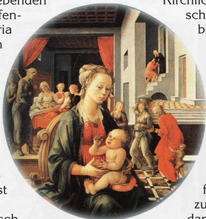
Maria als Kind mit Szenen aus dem Leben der Hl. Anna (F.Lippi)

Im Glauben Marias ist GOTT der Grosse, der Herrliche. «Machtatun wirkt ER. Gewalthaber stürzt ER», ruft sie im Magnifikat aus. Heute reden viele nur dann von Schuld, wenn Menschenrechte verletzt werden. Gegen GOTT zu sündigen – IHN zu leugnen, IHN nicht mehr anzubeten, nicht mehr am Gottesdienst teilzunehmen – wird als belanglos hingestellt. Das ist nicht marianisch.