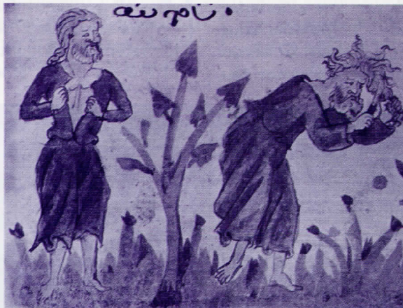
Nun stand Ijob auf, zerriss sein Gewand, schor sich das Haupt, fiel auf die Erde und betete an (Miniatur 15. Jh.).