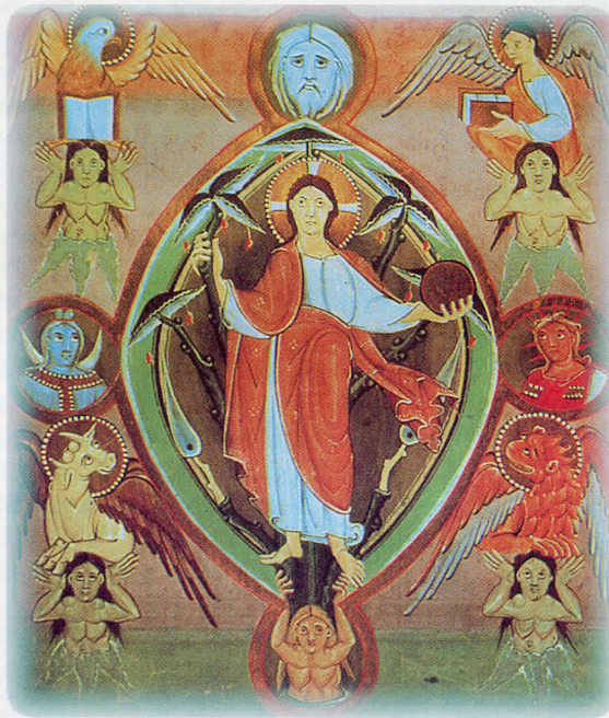
Maiestas Domini – der Weltenherrscher Sakramentar anfangs 11. Jh./ Köln

solcher gelästert und verhöhnt. Die Bevorzugung des Barabbas ist die Verwerfung des gottgesandten Königs durch Israel.